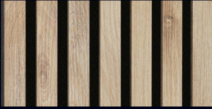
Eiche hell 07030 / Holznachbildung