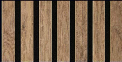
Eiche terrabraun 07031 / Holznachbildung