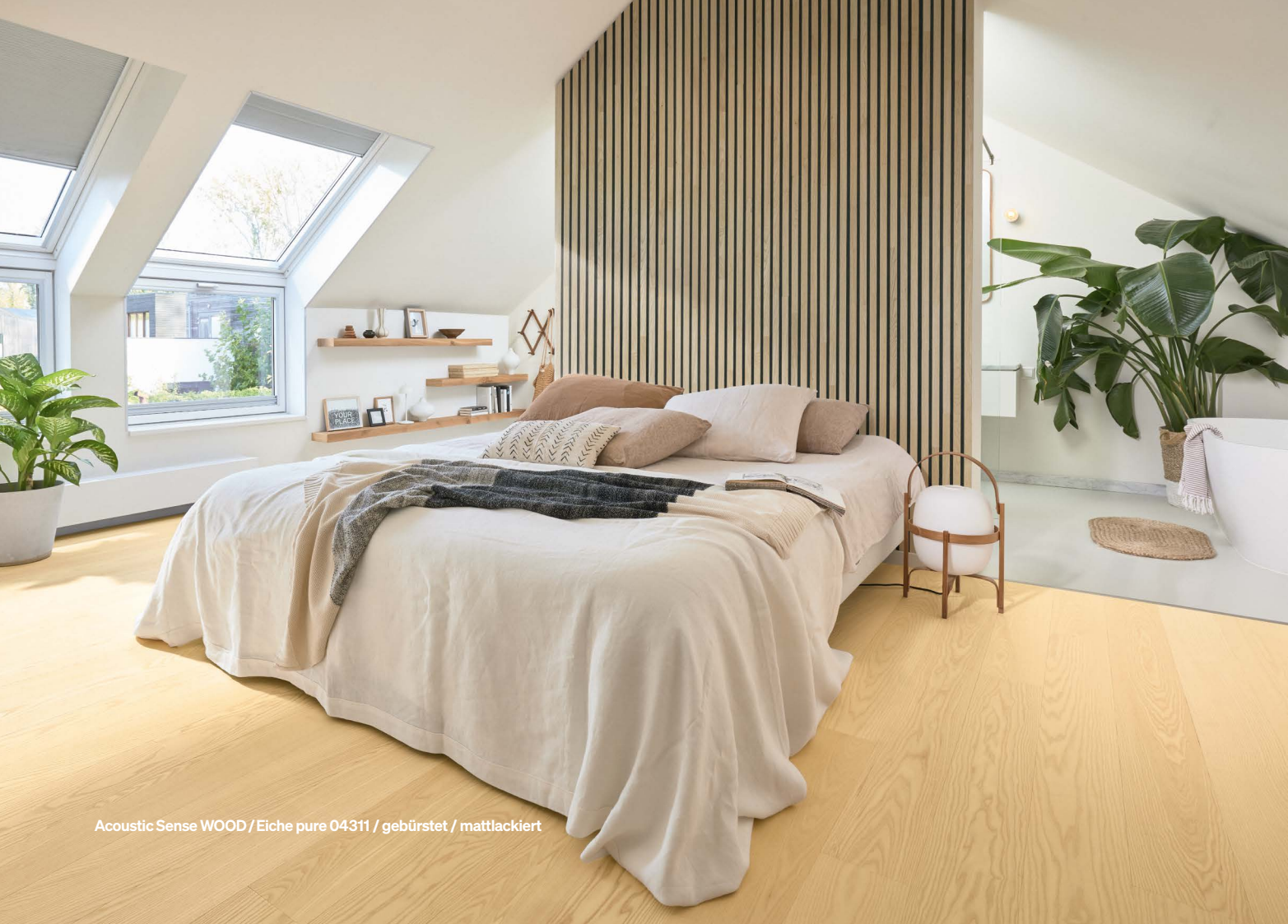
Acoustic Sense WOOD / Eiche pure 04311 / gebürstet / mattlackiert