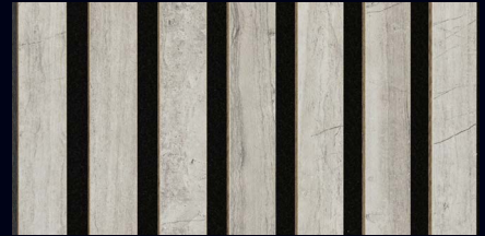
Gravel Stone 07035 / Dekor