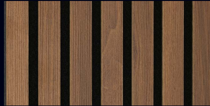
Nussbaum 07034 / Holznachbildung