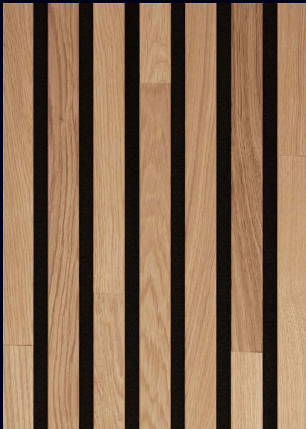
Eiche pure 04311 / gebürstet / mattlackiert