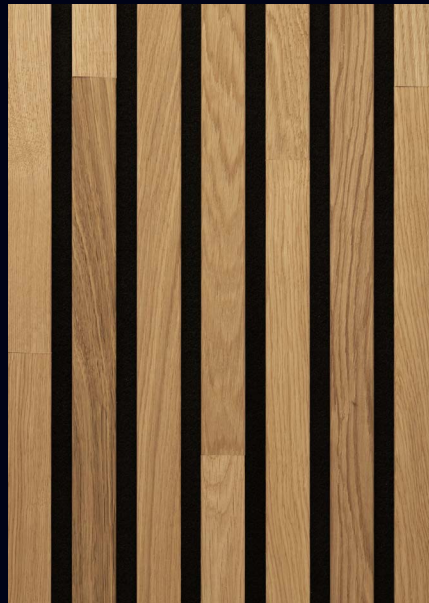
Eiche natur 04310 / gebürstet / mattlackiert