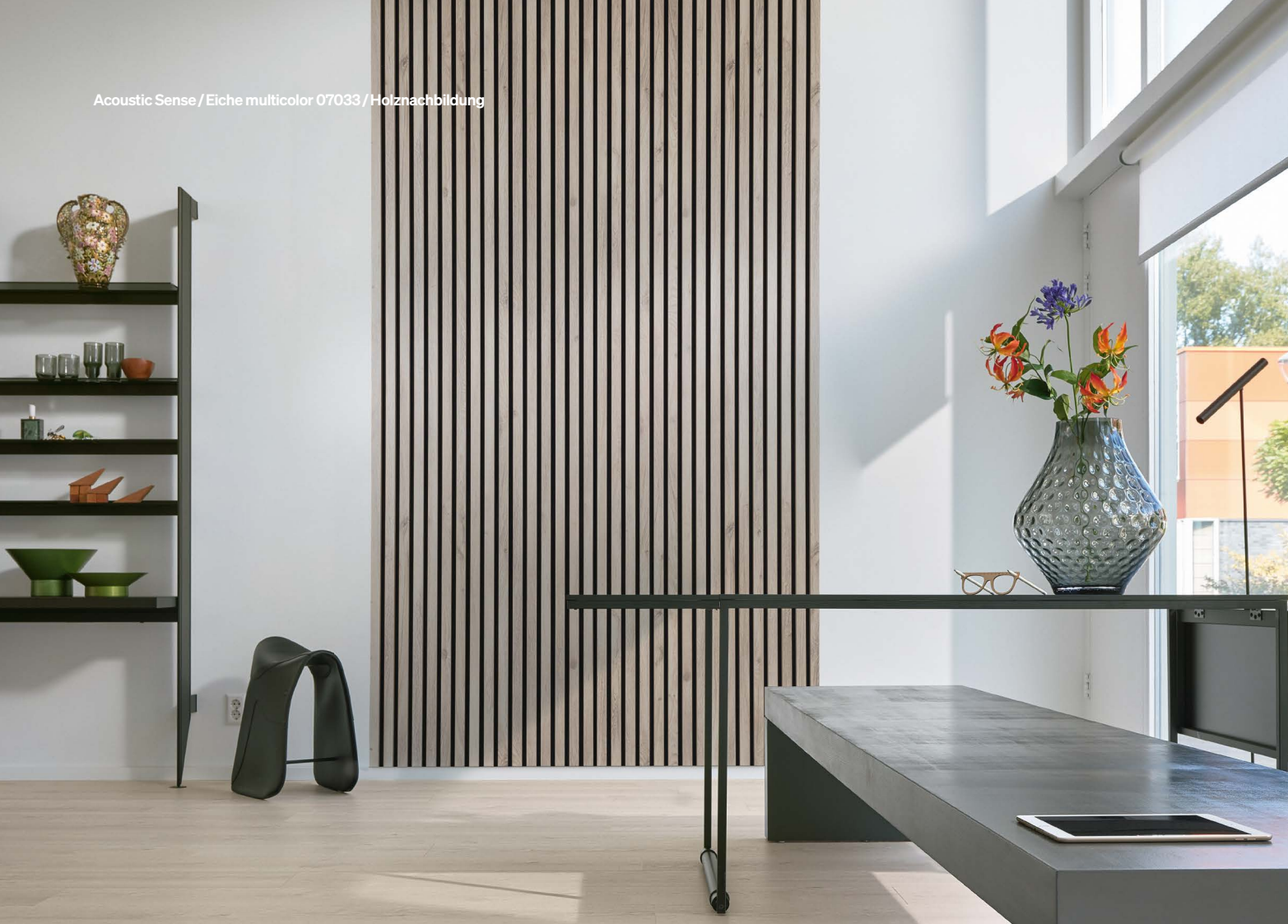
Acoustic Sense / Eiche multicolor 07033 / Holznachbildung