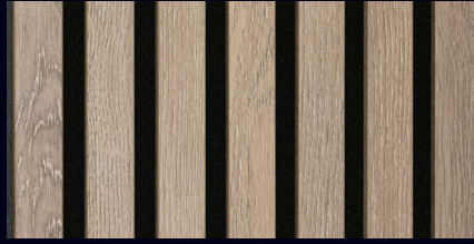
Eiche multicolor 07033 / Holznachbildung